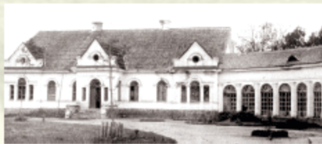
Šiaulėnų dvaras, 1929 m.

Šiaulėnų dvaras minimas nuo 1492 metų. Jis stėjamas su Šemetų gimine, čia užaugo keltos jos kartos. Išlikęs XIX a.