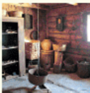
Šiaulėnų krašto muziejus

Čia surinkti įvairūs buities reikmenys, prietaisai, nuotraukos, istoriniai užrašai, kiti eksponatai. Muziejus įkurtas sename, 1929–1930 metais statytame name. PASTA-TO CENTRINĖJE DALYJE IŠLIKUSI autentiška virtuvė su duonkepe krosnimi bei kamina, kuriame buvo rūkoma mėsa.