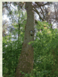
Viliošių miško pušis

Bažnyčios kalnu. Visat greta – Varpėnės (arba Varpnyčios) bei Kartuvtų kalnai. Apte juos žmonės pasakoja įvairių padavimų. Sakoma, jog čia buvusį miestą užpusė smėlis, o po didžiosiomis kalvomis slypi bažnyčia ir varpėnė.