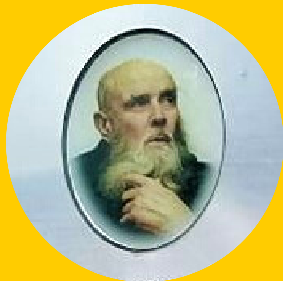
Dariaus ir Girėno g. 15 Radviliškis