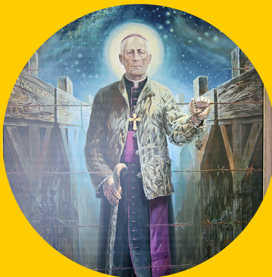
Vilniaus g. 7 Šeduva, Radviliškio r.