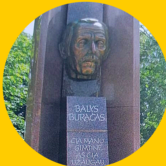
Šiaulėnų miestelio centrinė aikštė, Radviliškio r.

Šiaulėnų miestelio centre 2011 m. atidengtas paminklas iš Radviliškio rajono Sidarių kaimo kilusiam krašto šviesuoliui Baliui Buračui. Paminklo autorius – kraštievis Stasys Žirgulis. Balys Buračas – pedagogas, garsus fotografas, etnografas, kraštotyrininkas. Keliaudamas po Lietuvą, sukaupe didžiulį fotografijų archyvą – daugiau kaip 18 tūkst. negatyvų ir dvigubai daugiau pozityvų. Buvo surinkęs apie 4 200 dainų, 7 600 papročių ir smulkiosios tautosakos pavyzdžių, šokių bei žaidimų aprašymų, 6 400 margučių, 800 lietuviškų tautinių juostų. Paskelbė apie 600 straipsnių. Šiaulėnų krašto muziejuje įrengta erdvė, skirta broliams Baliui ir Jonui Buračams, jų veiklai atminti.