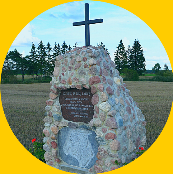
Aušrėnų kaimas, Radviliškio r.