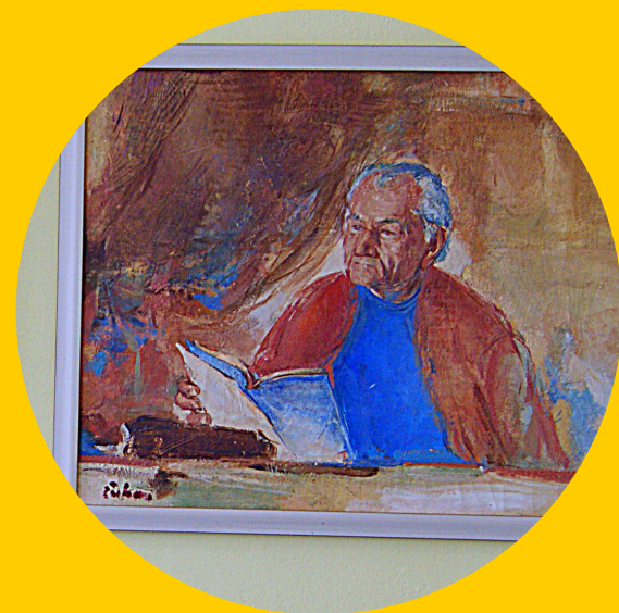
Vaižganto g. 4, Sidabravas, Radviliškio r.