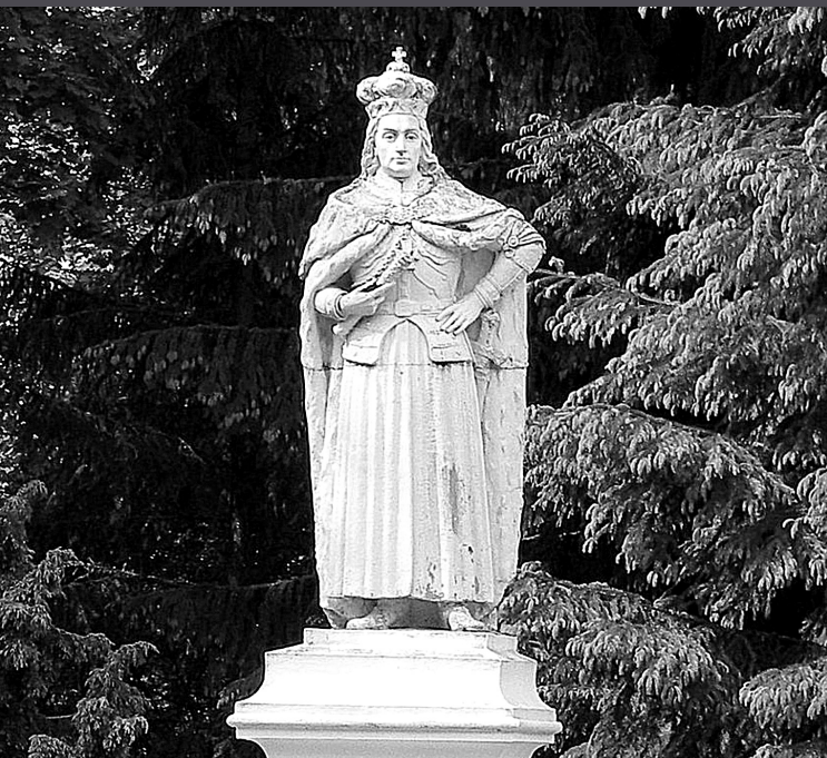
Burbiškio k., Pakalniškių sen., Radviliškio r.

Kaimo šalikelėje stovi akmeninis paminklas Vytautui Didžiajam, pastatytas 1930 m. jame – užrašas: „1930 m. Vytautas Didysis 500 m. paminėti“.