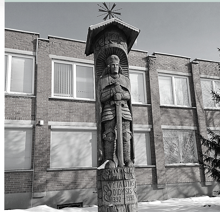
A. Povyliaus g. 2, Radviliškis