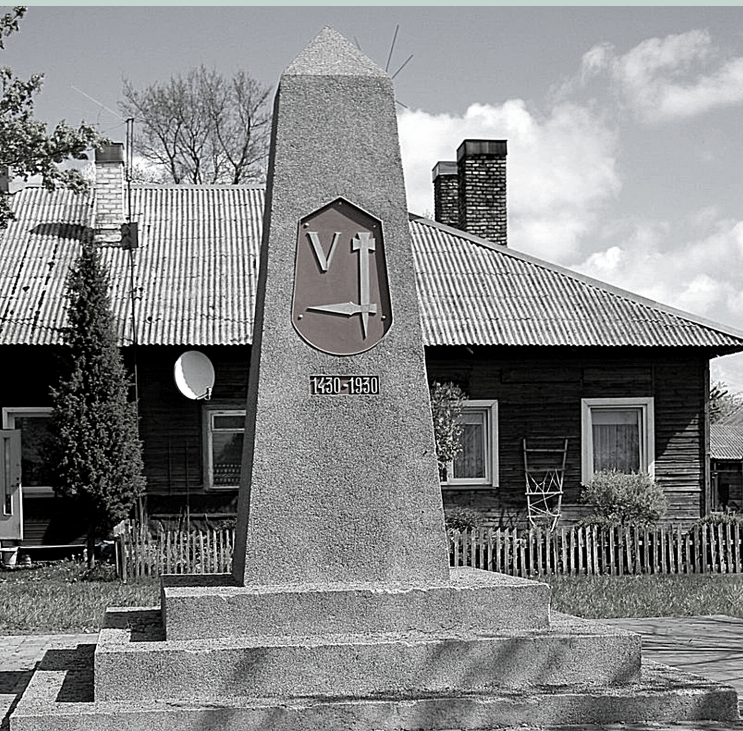
Klaipėdos g. 19, Radviliškis

2017 m., švenčiant Radviliškio miesto 450-ąjį jubiliejų, paminklas atnaujintas: padengtas granito sluoksniu, aplink pakeistos plytelės, sutvarkytas skydas su Vytauto Didžiojo ženklu ir įrašas „1430–1930“.