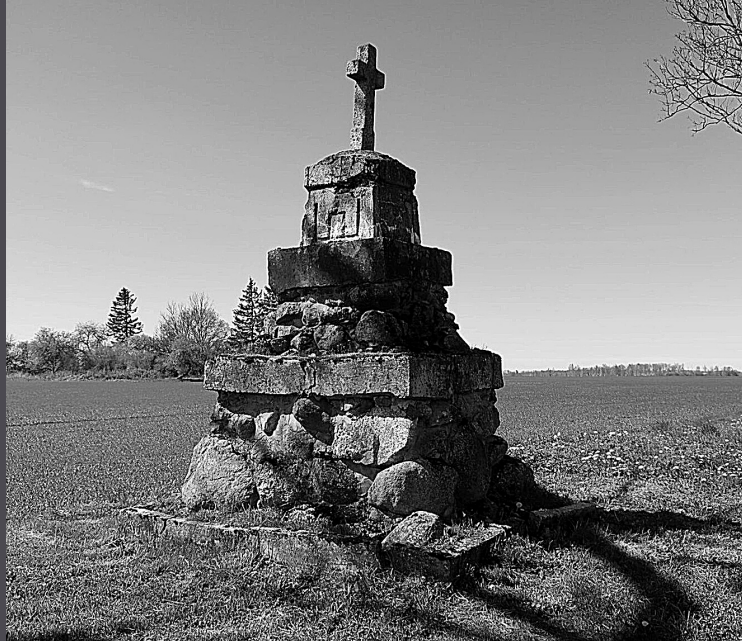
Genių k., Sidabravo sen., Radviliškio r.

Paminklas beveik nepažeistas išsilaikė nuo 1911 m. iki šių dienų. 1968 m. Kultūros ministerijos lėšomis jis buvo iš dalies restauruotas. 1990 m. rajono paminklotvarkininkų pastangomis restauruotas postamentas, o 1995-aisiais – skulptūra.